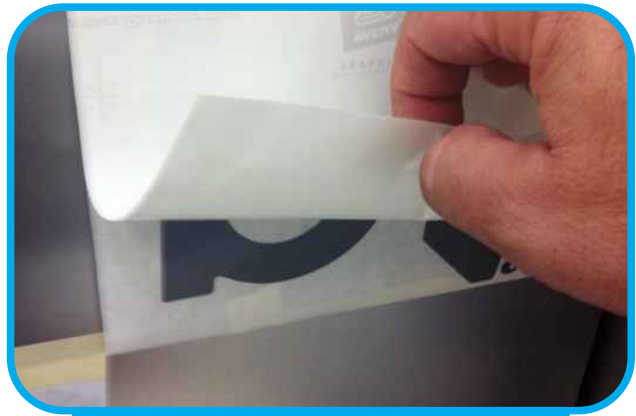
Ribaltare l'adesivo verso l'alto e staccare la carta siliconata dal supporto delicatamente.