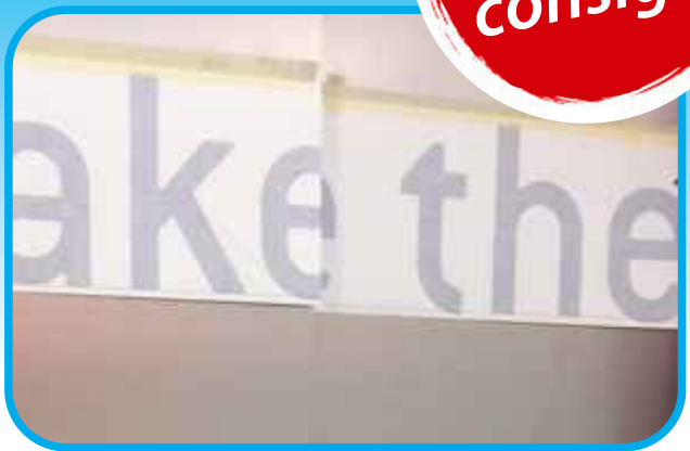
Se la posizione è corretta fissarlo per tutta la sua lunghezza nella parte superiore e pressare l'adesivo con la spatola.