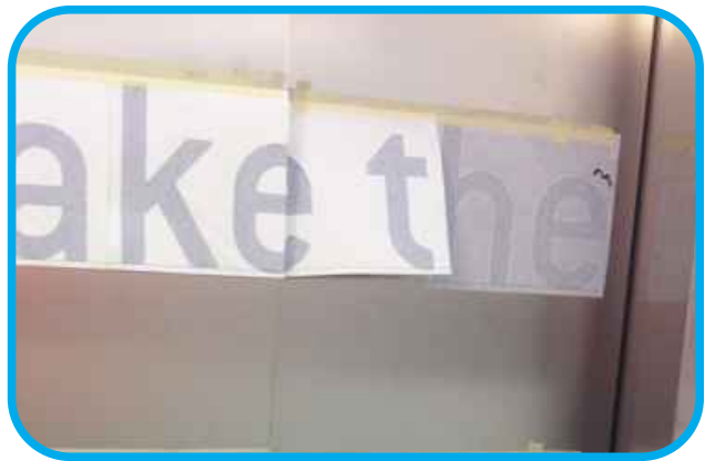
Ripetere l'operazione per i vari pezzi (piu' sono piccoli e maggiore è la facilità dell'applicazione). Una volta terminato togliere la pellicola di trasferimento delicatamente.