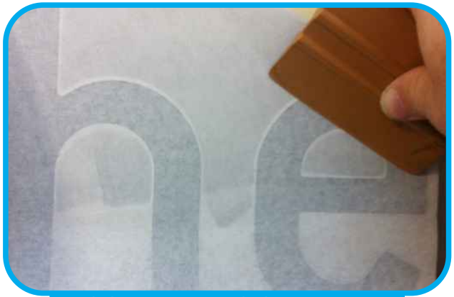
Ribaltare nuovamente l'adesivo e premere forte con la spatola partendo dall'alto verso il basso in modo da fare uscire l'aria.