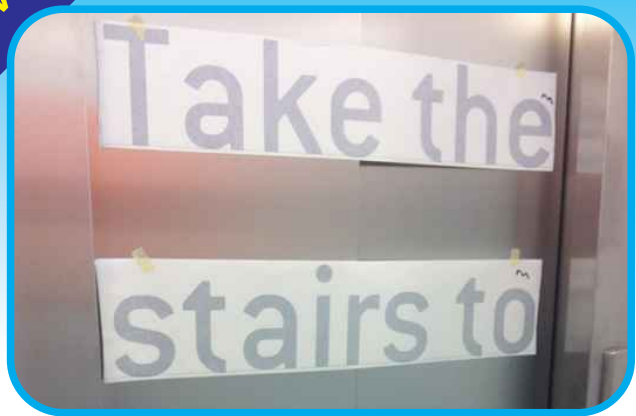
Posizionare l'adesivo prespaziato e fissarlo con del nastro carta.